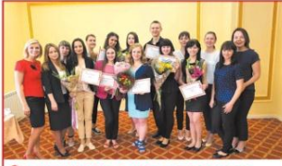
Стипендиаты с директорами и консультантами по производству

Традиционно в мае-июне «Макдоналдс» проводит торжественные мероприятия в честь студентов, которые успешно совмещают учёбу и работу. Они получают специальную стипендию компании. Обладателями именных стипендий «Макдоналдс» в 2016 году стали более 350 работников. География программы поддержки образования охватывает сегодня более 90 городов России: от Пятигорска до Петрозаводска, от Калининграда до Новосибирска. Волгоград не является исключением, в этом году в нашем городе лауреатами премии стали 8 студентов. Все на «отлично!»